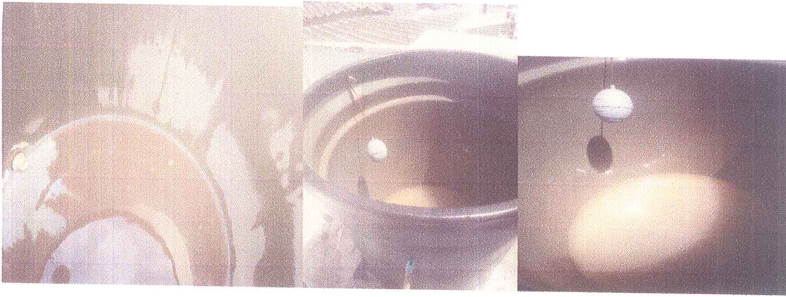
En esta imagen se puede apreciar terminacion del mantenimiento