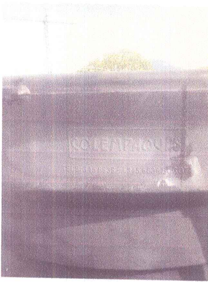
En esta imagen se puede apreciar el tanque de almacenamiento de agua