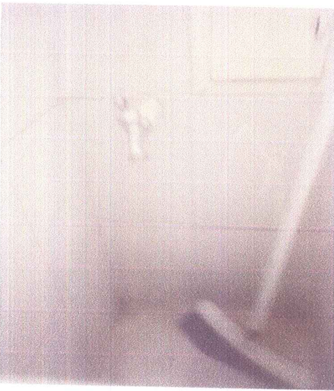
En esta imagen se puede apreciar la marca del tanque de almacenamiento de agua