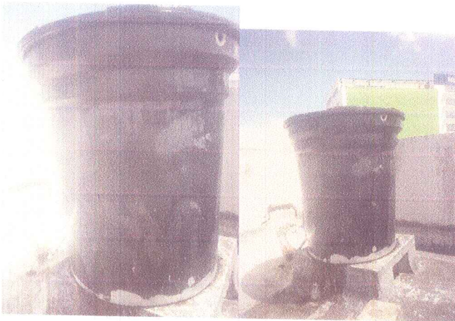
En esta imagen se puede apreciar el contenido que se encontro en el proceso del mantenimiento del tanque de almacenamiento de agua